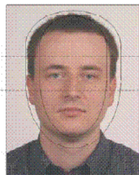
Příklad fotografie / Контрольный шаблон